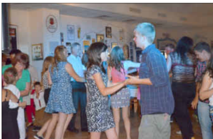
Jeder Abschied fällt schwer - wir feiern gemeinsam ein letztes Mal!