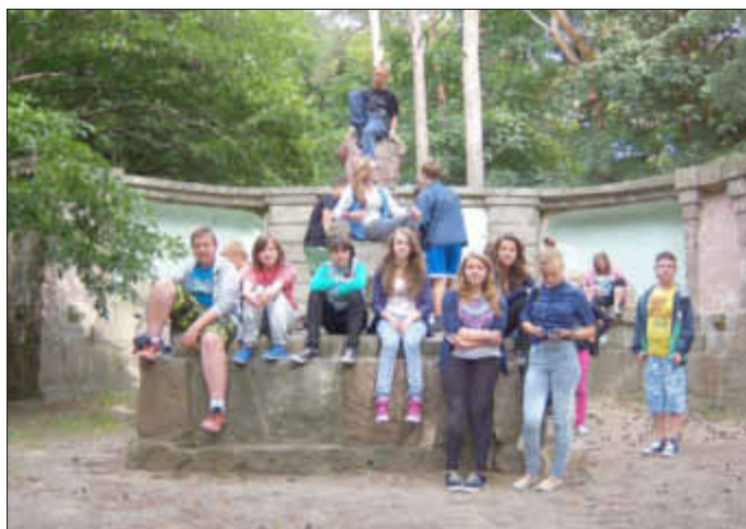
Der „Aufstieg“ zum Ulanendenkmal war ganz schön anstrengend!