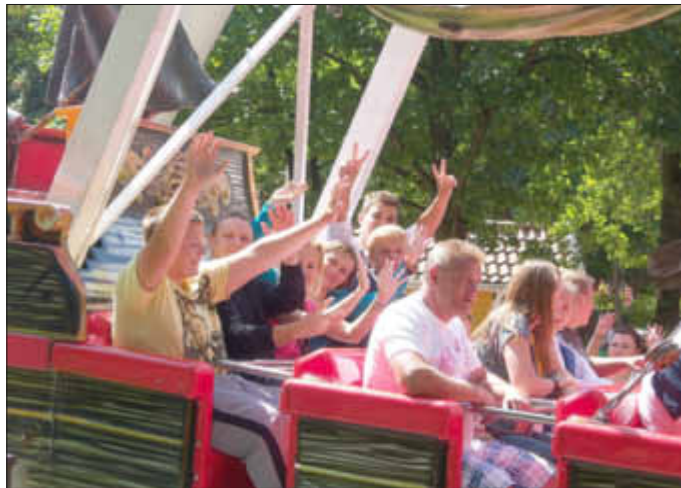
Nicht nur für die Kinder ein Riesenspaß!