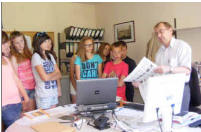
Zu Besuch beim Nordkurier - Danke!