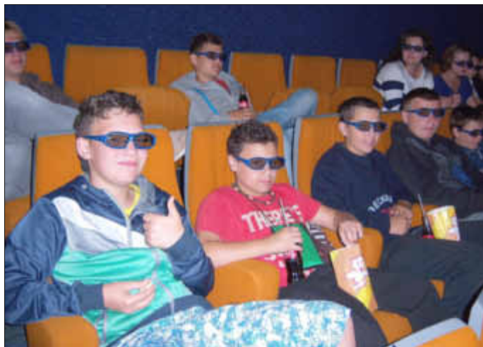
3D-Kino - man sind wir alle cool!