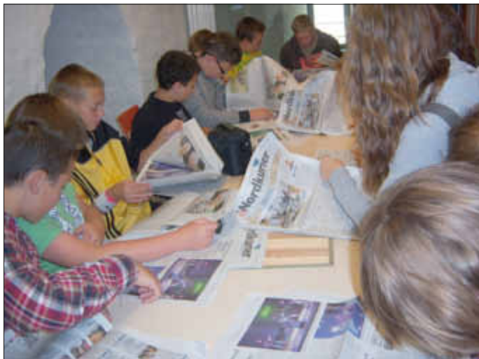
Zeitungsschau im Luisentor - Wo bin ich???