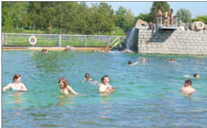
Bei den Temperaturen das schönste Vergnügen - Baden in der Biberburg!