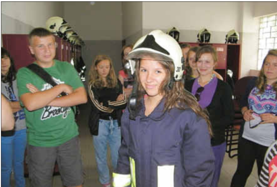
Eine neue Kameradin der Feuerwehr - beim Rundgang.

Die Hansestadt Demmin dankt für die Unterstützung und Hilfe: den Betreuern, der Dolmetscherin, dem Feuerwehrverein Demmin, den Mitarbeitern der „Biberburg“, der Demminer Verkehrsgesellschaft mit ihren freundlichen Busfahrern, dem Hanseviertel Demmin e. V., den Jungen Europäern, dem Nordkurier, der TOP-VIDEOTHEK Beetz, dem Abenteuer Peenetal, der Peeneschiffahrt Ingo Müller, dem Tannenrestaurant, dem Fischhandel Willert und den Peenewerkstätten, die diese Stunden für alle Beteiligten zu einem Erlebnis machten!