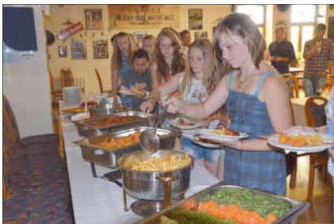
Unser letzter Abend - ein leckeres Büfett erwartet uns!