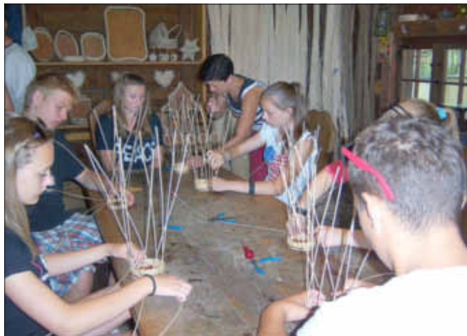
Wir basteln uns was - im Hanseviertel auf der Demminer Fischerinsel!