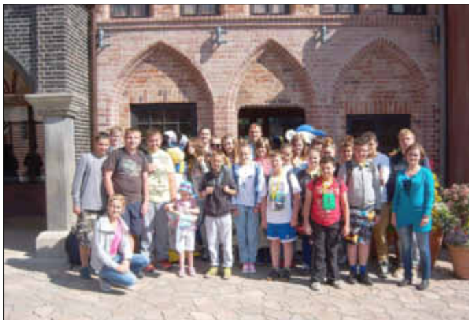
Der Hansapark in Sierksdorf wartet - die Spannung steigt!