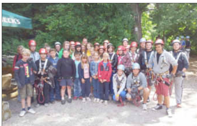
Obwohl wir es durch den Kletterwald in Waren gewohnt waren!