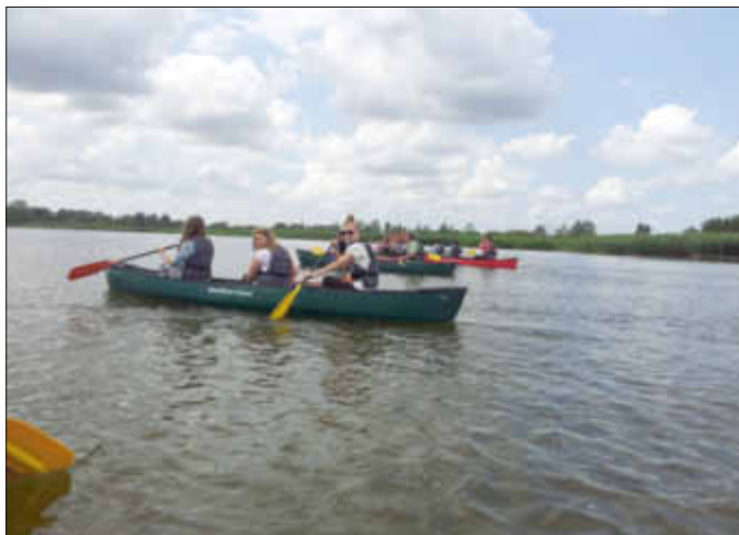
Sport wurde bei uns groß geschrieben - Kanutour auf dem Kummerower See!